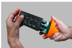
Figure C Gypsum Block Sensor Assembly/